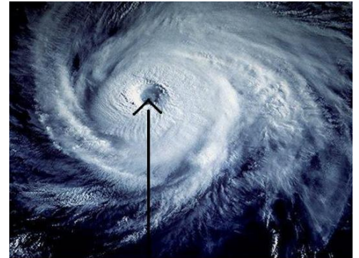
OEIL DU CYCLONE

● L'œil du cyclone correspond à la partie centrale (20 à 50 km de diamètre).